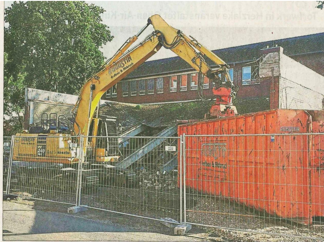
Dem Erdboden gleichgemacht wird die Gymnastikhalle der Marienhausschule Meppen.